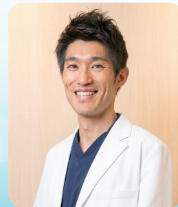
日本整形外科学会認定 整形外科専門医

安全で丁寧な診療を心がけ、皆さまの「 動ける毎日 」を支えるお手伝いができれば幸いです。